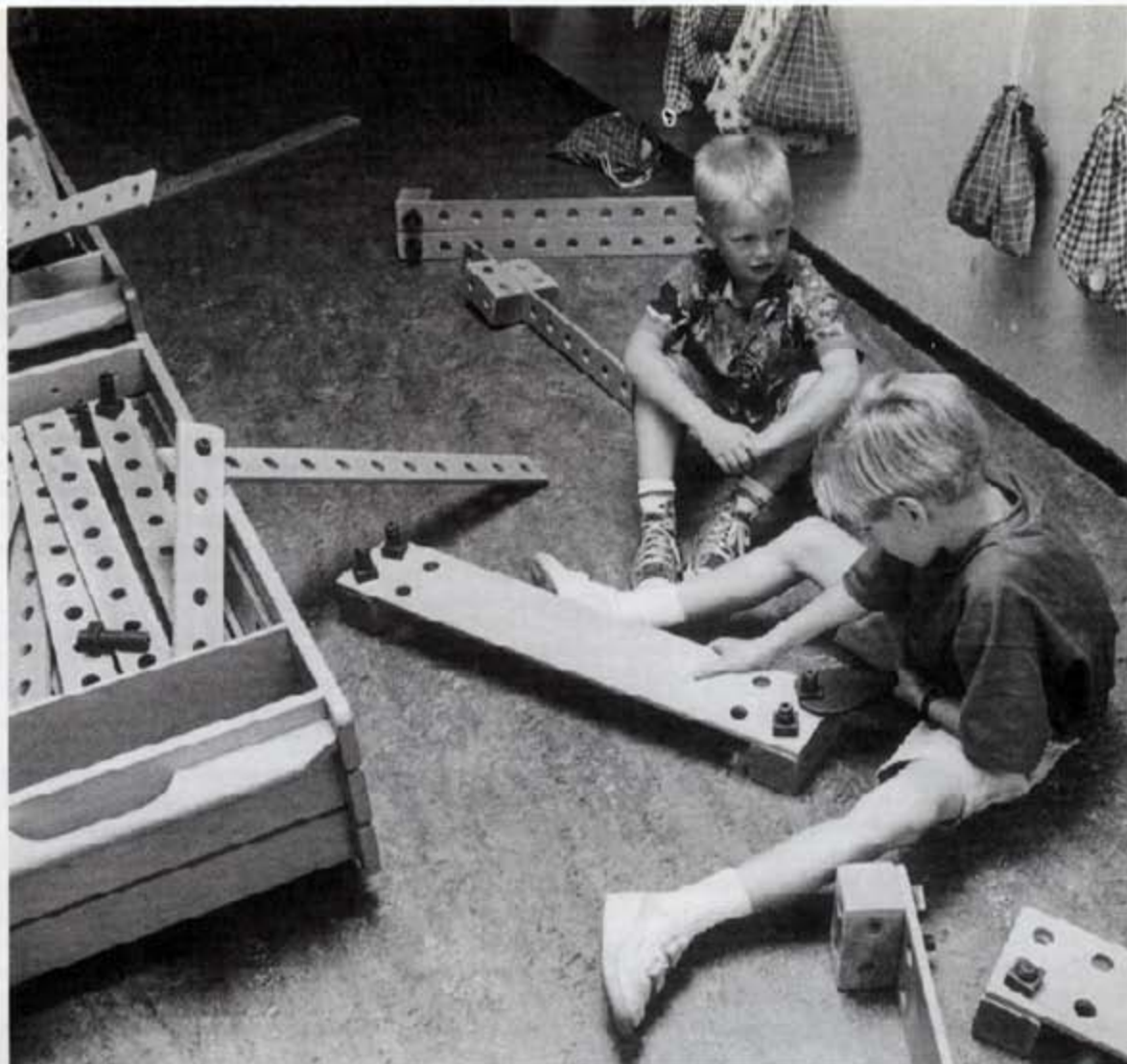
Jonge kinderen moeten zoveel mogelijk bewegingservaringen opdoen.